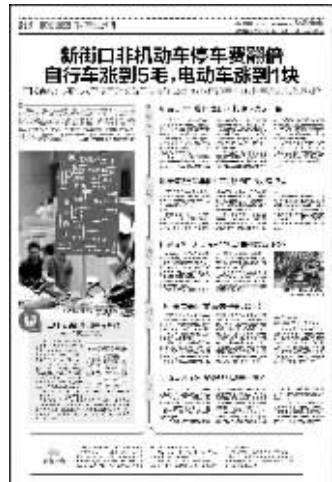
现代快报昨日相关报道

如今政府大力倡导绿色出行, 目前南京绝大多数非机动车停车点确实是免费的。不过, 还是有部分停车点是收费的, 所以就有市民建议, 政府应该对全部的非机动车停车都不收费, 相关管理成本, 可以用收取的机动车停车费来补贴。