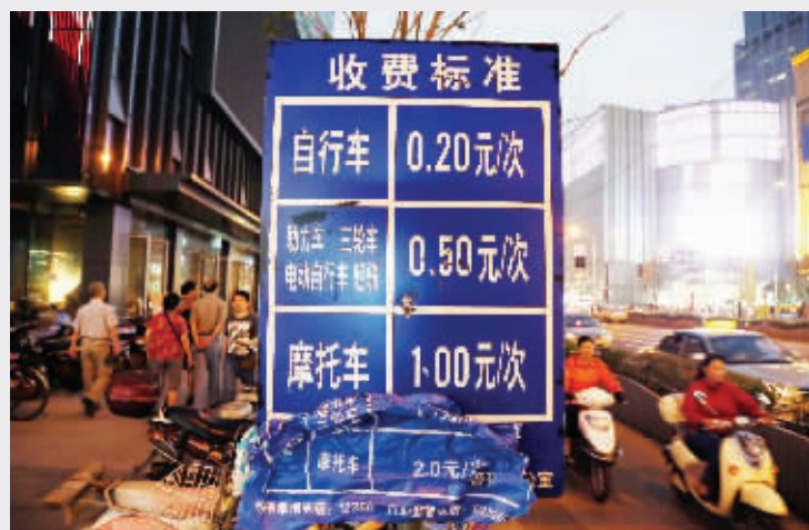
新街口一处非机动车停车点, 撕掉一半的“涨价标准”还贴在收费牌上