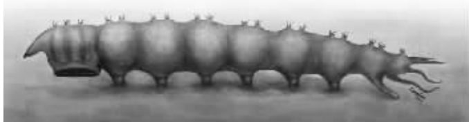
奇异虫复原图