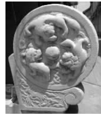
被盗的石鼓

本报讯(通讯员 其定 记者 宋体佳)昨天上午,高邮当地论坛上,一篇名为《提供重要线索的,奖励1万元》的网帖引发围观。发帖者称,家中祖传“门石”夜间被小偷盗走,悬赏1万元征集线索,网帖中还附有手机号码。现代快报记者拨打这个号码,联系上了发帖人吉先生。据吉先生介绍,丢失的“门石”此前一直放置在岳父母住宅门前,7月2日早晨5点多,岳父母发现“门石”不见了,当即打电话报警。吉先生证实,悬赏1万元征集线索一事属实,“这个东西被偷后,家里人开心不起来,就是想快点儿找到。”