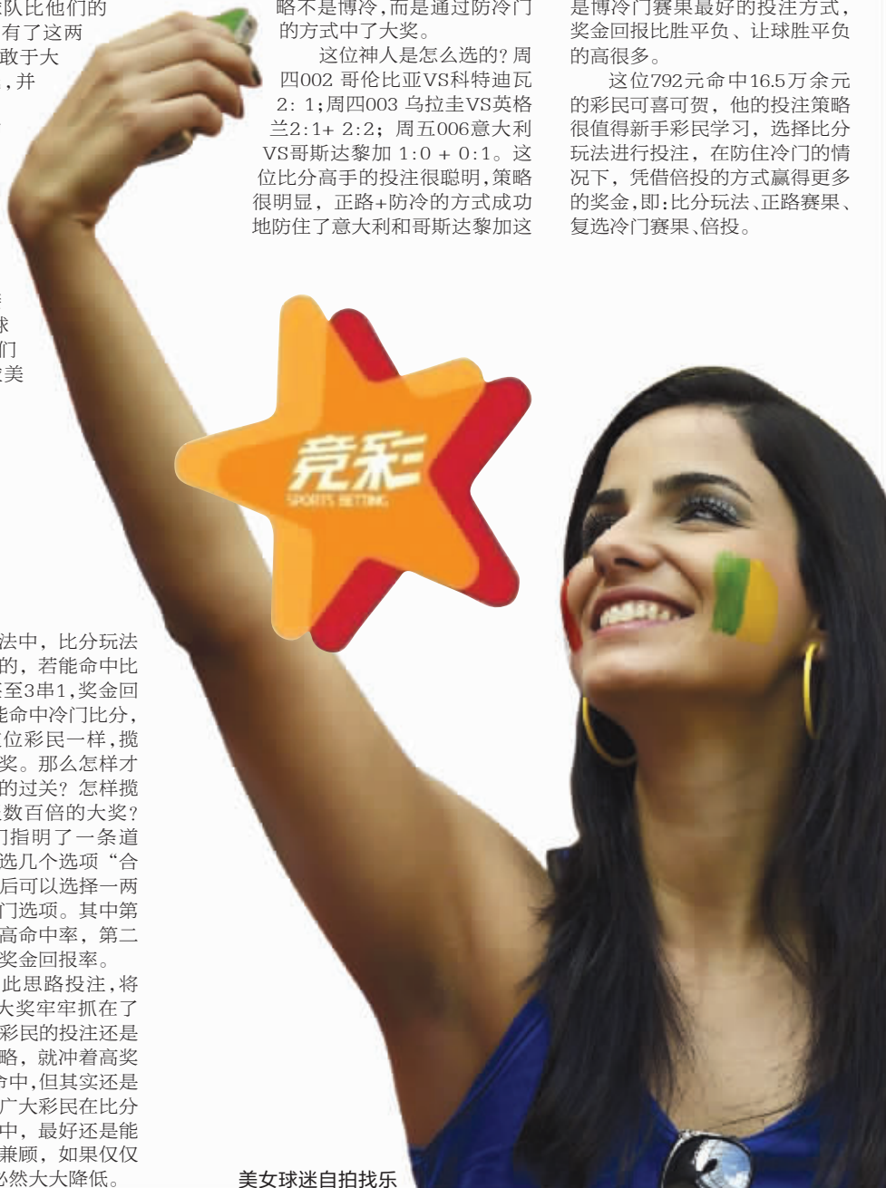
美女球迷自拍找乐

根据对胜平负和总进球数的预测,在一个合适的范围内框定比分,例如判断主队赢球,且进球数不超过3个,则可选择1:0、2:0、2:1、3:0等几个比分选项。