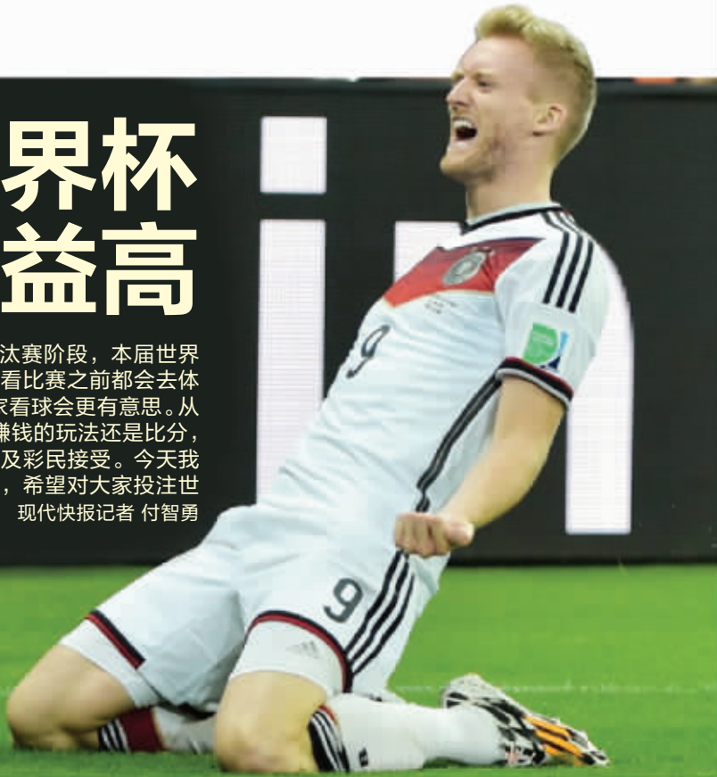
德国队赢得很艰难