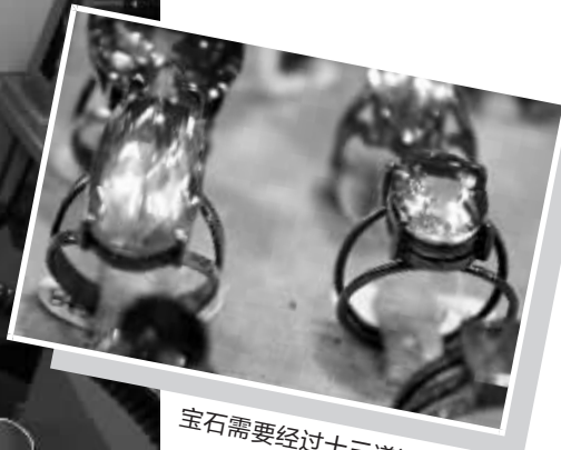
宝石需要经过十三道流程加工