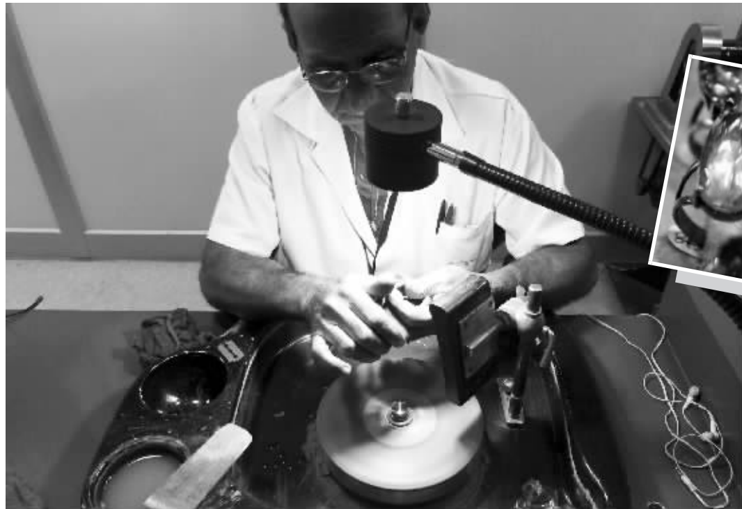
工匠正在打磨宝石