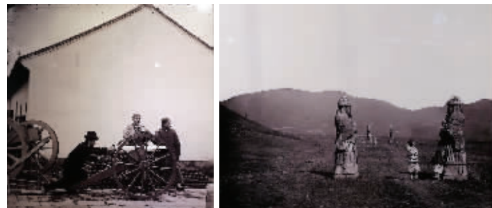
140多年前,英国摄影师拍下的金陵制造局和明孝陵