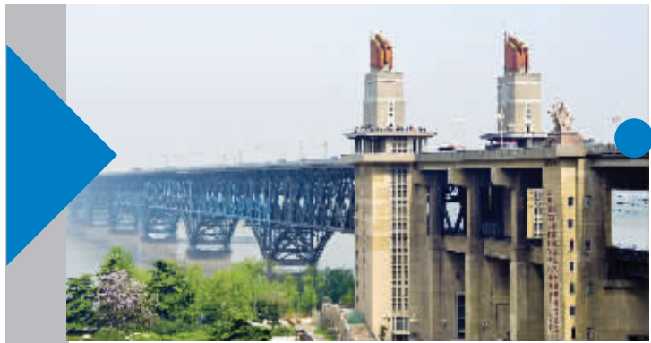
南京长江大桥