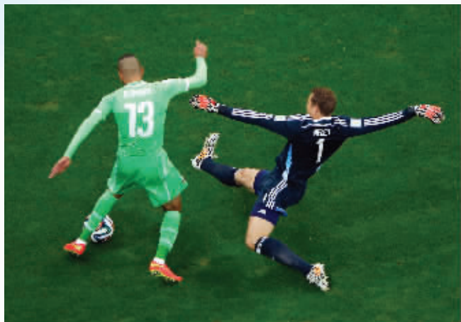
诺伊尔(右)在本场比赛中成了德国“第五后卫”