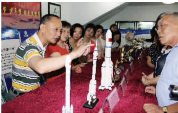
工作人员为居民介绍航天模型