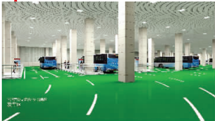
南湾营公交场站效果图

昨天,现代快报记者从效果图上看到,这个公交新“家”非常时尚,地面全是绿色的,很清新。同时,场站顶面从原来的80厘米加厚到1米,上面覆土种植绿化植被,成为公交场站的一个生态遮阳伞。