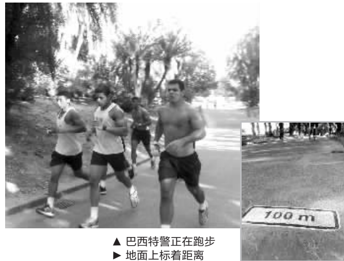
▲ 巴西特警正在跑步 ▶ 地面上标着距离