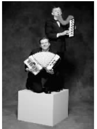
“古典怪咖创意秀”的“怪咖组合”

而“古典怪咖创意秀”则是一场家庭里所有年龄段的成员都会喜爱的音乐会。“怪咖组合”的两位音乐家脱去严肃庄重的古典音乐外衣,拿着荷兰木屐演奏巴赫、用鼻子吹小提琴完成卡门序曲,他们还表演起魔术、脱口秀、默剧。一场音乐会,不仅让孩子见识