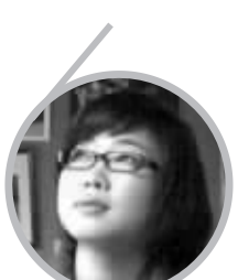
黄佟佟 作家,人物记者

上世纪80年代红极一时的香港歌手陈慧娴为庆祝入行30周年,19日开始在红馆一连三场“Back To Priscilla陈慧娴30周年演唱会”,网上的最新新闻是她因为丝裙拉链爆开推迟演唱会,令现场观众六度发出嘘声。