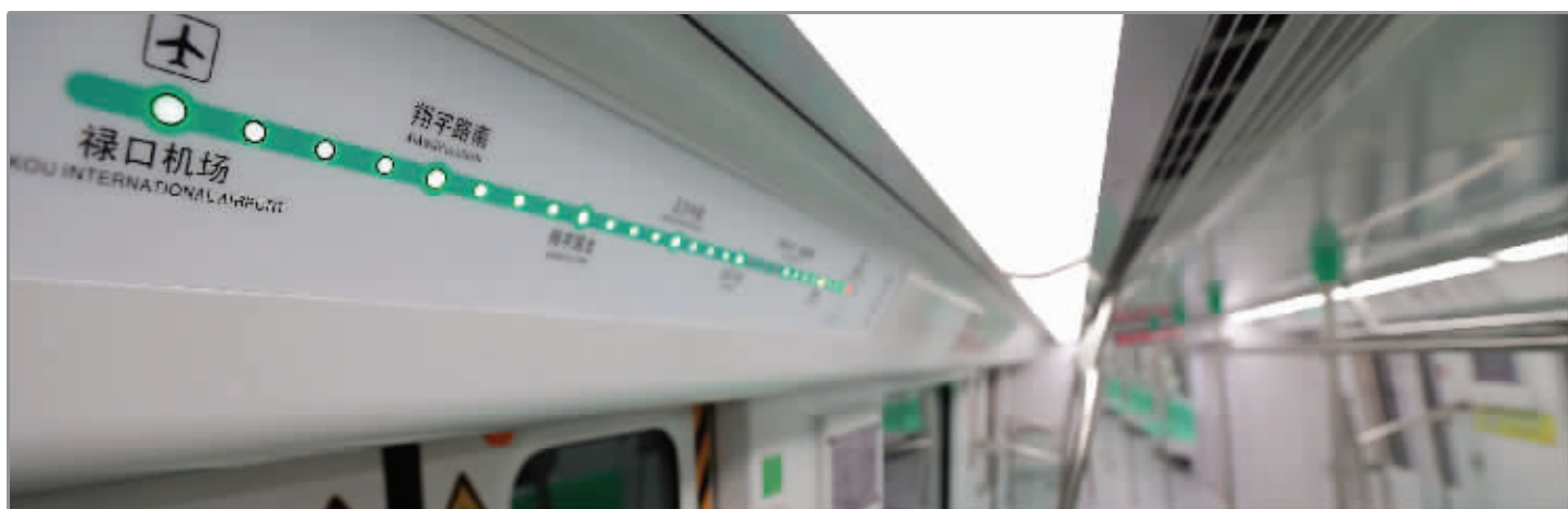
地铁机场线车厢没想象中那么窄

据了解,南京南控制中心采用多线集中共享建设的前卫设计理念,主要管辖南京市南城线路,包括3号线、5号线、6号线、宁高城际线、宁和城际线、宁溧城际线6条线路。6线共享式调度方案在南京尚属首次,多线共享更能充分体现调度资源集中化,线网调度协调化,在发生紧急事件时做到线路间应急指挥的协同化。