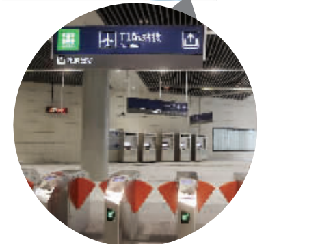
地铁机场线禄口机场站各处指示标志清晰明了 制图 李荣荣