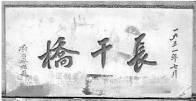
南京长干桥石碑 资料图