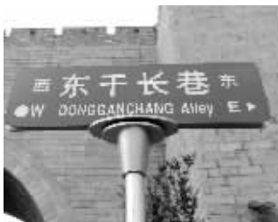
新路牌都叫干长巷,可市民们都习惯喊长干巷