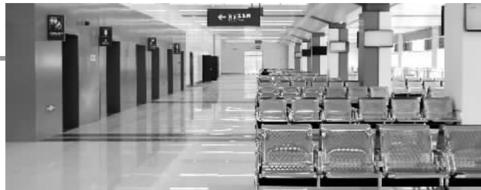
小红山客运站2楼候车大厅崭新亮相