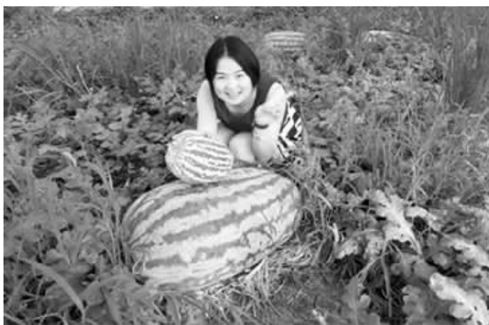
普通的西瓜摆在“西瓜王”面前,就跟小苹果一样