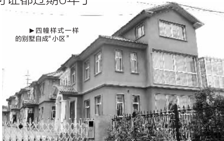
四幢样式一样的别墅自成“小区”

对于下一步如何处理,街道方面称,目前他们工作重点公共场所的违建和占道经营等清理,对于这些居住类的、相对复杂的,他们将列入下一步讨论整治的范围。