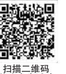
扫描二维码 关注本次活动