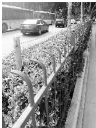
绿岛里装了两道隔离栏