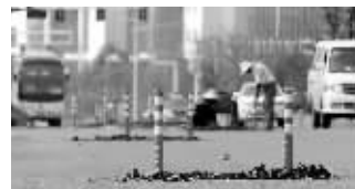
窨井旁竖着隔离栏

快报讯(记者 陈志佳)江宁区将军大道天元西路到佛城路一段,总长大约1.5公里,至少有七八十个窨井在快车道上,而且还凸出路面。昨天下午,现代快报记者从施工方了解到,将军大道改造工程尚未完工,之后会在路面摊铺沥青,窨井就不会凸出路面了,也可以防止路面下陷。