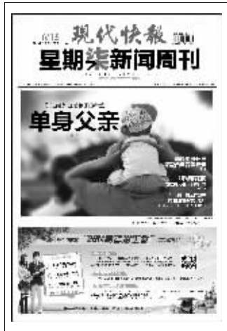
(上期星期柒新闻周刊封面)

《环城七十里》将南京如诗如歌的形象展现给观众,这是对一直低调内敛的南京最好的诠释。一座城,一群人,过去,现在,将来,其实,长期生活在一个城市,时常有很多盲点,我们对自己生活的城市并不那么了解。换一个角度,一部电影让更多的人,看到更丰富立体的南京。 @金陵小妮