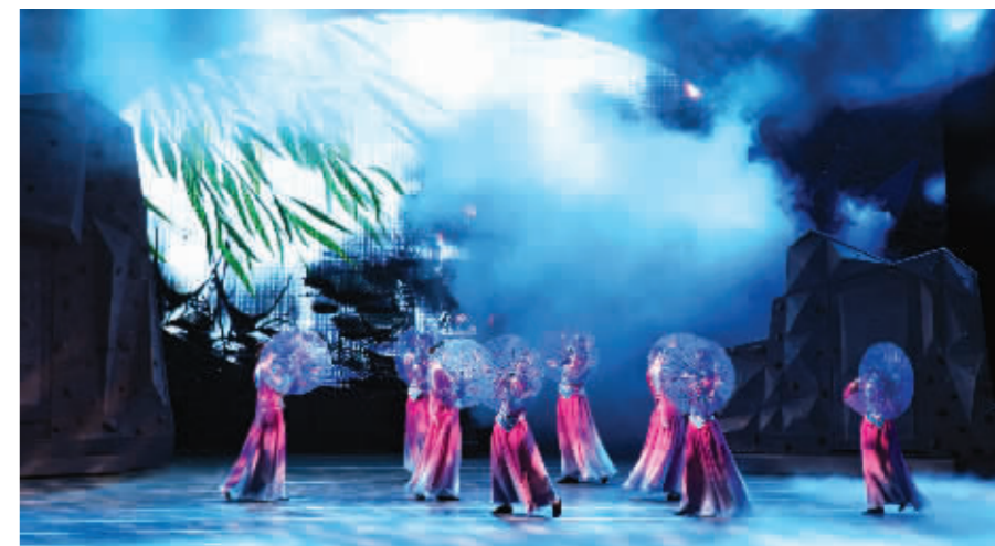
剧中舞蹈·江城四月