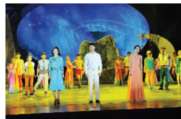
剧中的三位年轻人汇集在一起的情景