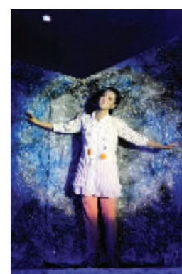
海风倾诉对百川的思念