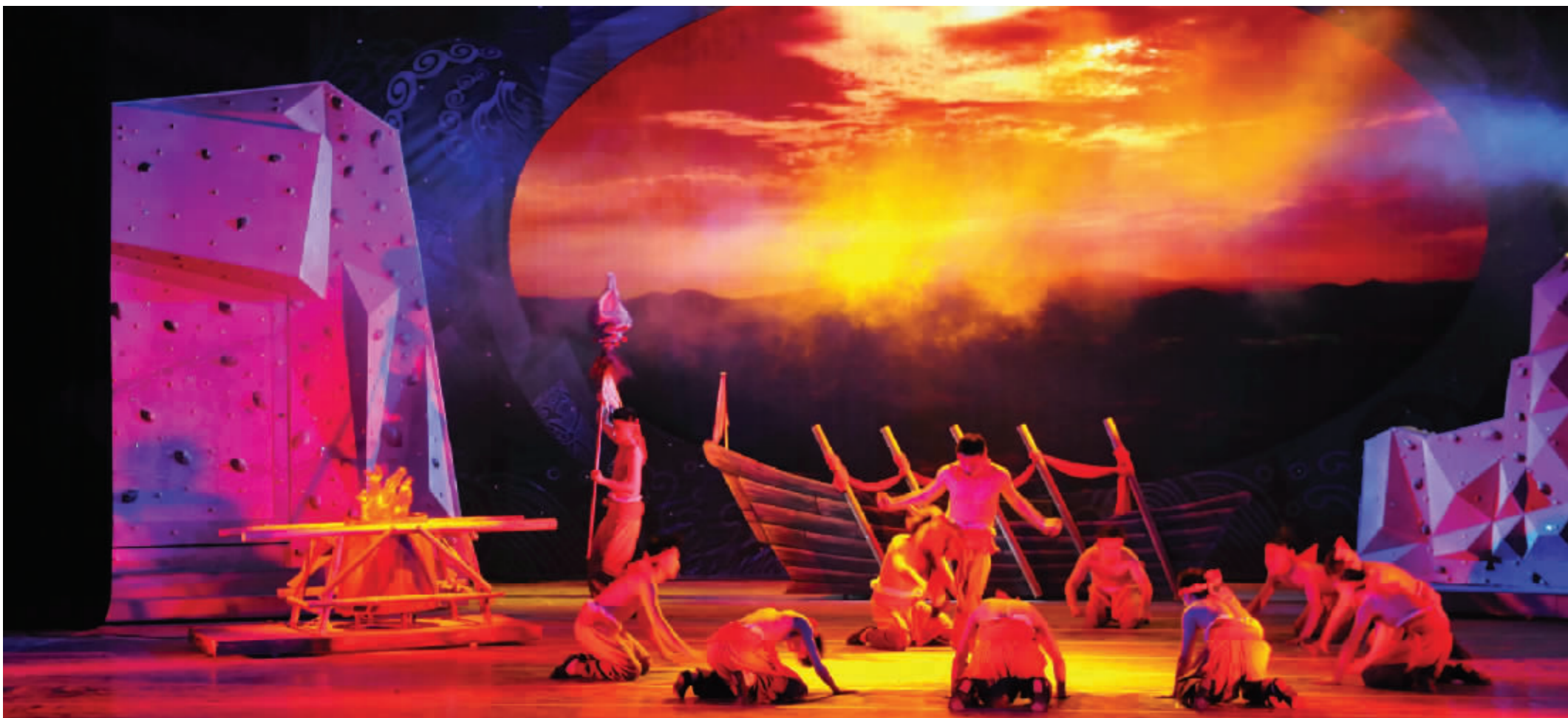
开场序曲·海门本土人出海打渔前的祷告仪式