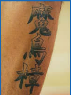
马里昂腿上的“魔鸟樟”无人能懂