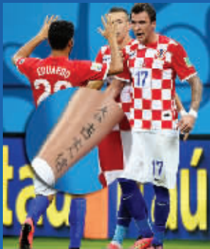
曼祖基齐文身让他得到“大壮”的外号