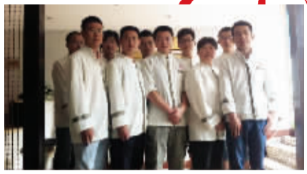
舒纤乐龙江店全体推拿师