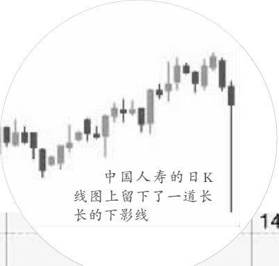
中国人寿的日K线图 图上留下了一道长长的下影线