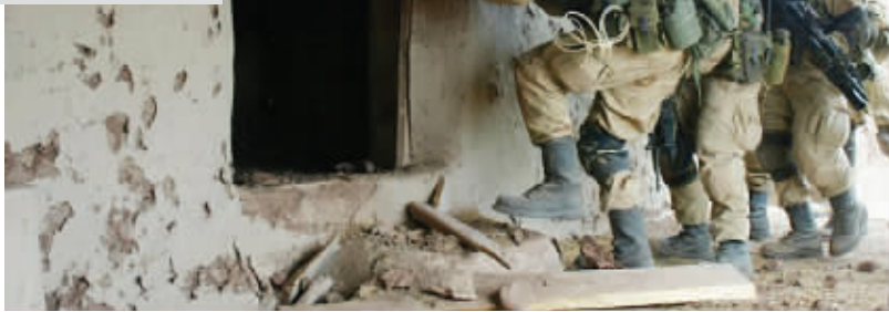
美国“三角洲特种部队”