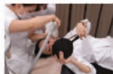
局部疏通,逐层清斑

“斑”实质上是五脏六腑不健,气血津液失调在面部的反映,“经络祛斑”从一开始,就会根据皮肤与脏腑、经络、气血、津液的关系,做全面的观察与分析,并通过刺激经络来调节气血津液以求和缓疏理,最终达到祛除斑点的目的。