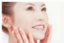
完全无痛,美肌无痕