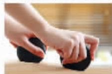
经络疏通,祛斑无痕