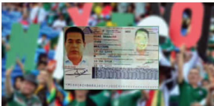
在巴西被逮捕的毒枭何塞

据阿根廷《Infobae》网站报道,6月17日,一名遭国际刑警组织通缉的49岁墨西哥毒枭在巴西里约热内卢市落网。这名毒枭是个足球迷,为了看世界杯,他竟然使用真实的身份证明文件购买了飞机票,从而暴露了行踪。