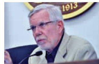
圣玛利诺市长尼尔

圣玛利诺市民为“丢狗粪市长”感到丢脸,发动罢免。而相关人士为低调解决此事,私底下与刘