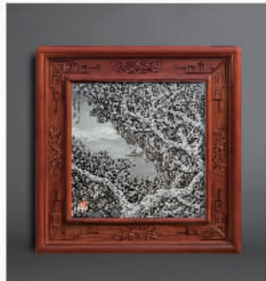
张松茂大师作品《豫韵寒江雪》