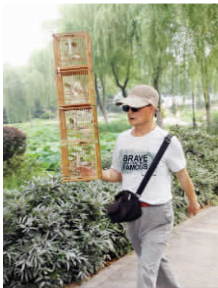
单手举4只鸟笼,边练腕力边遛鸟。 6月8日摄于莫愁湖公园