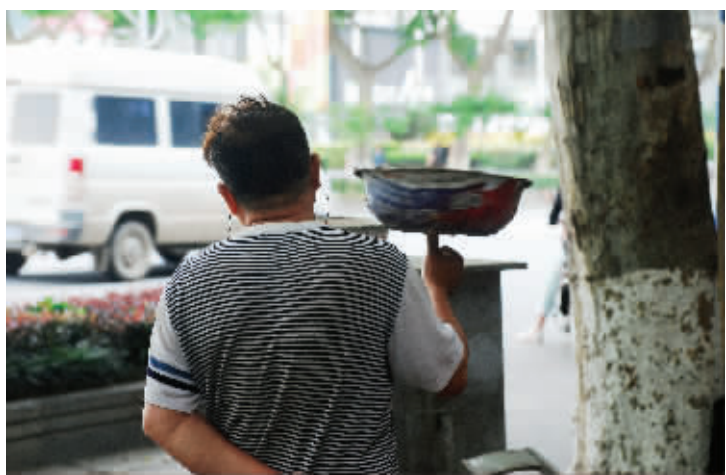
因陋就简,大爷没事就爱玩个转盆。时间长了,没准也能悟出个“太极盆”来。 6月2日摄于中央路