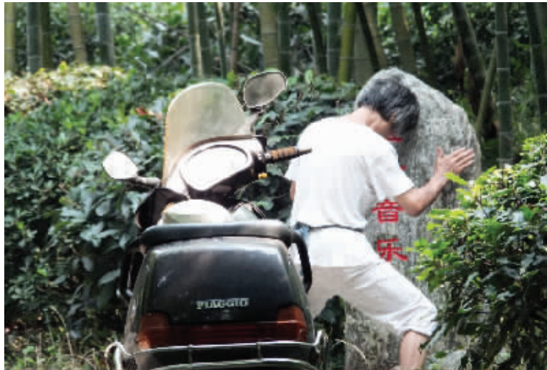
大叔,您这是在练铁头功吗?小心,这撞坏了可是要赔偿的! 2014年6月15日摄于紫金山