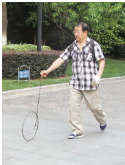
大叔铁环滚得不错,这执笔写字的手势也摆得很正。 5月25日摄于小桃园