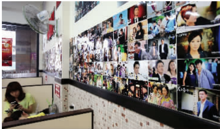
墙上贴满了TVB明星的各种剧照

6月8日,一家以TVB为主题的茶餐厅在南京悄悄开业,无论是吧台上的“关二爷”,厨房门上的“香港地铁站名”,还是马赛克地砖和卡座,都一比一还原了香港餐厅,而餐厅老板娘更是一个资深的TVB粉。 现代快报记者 郝多