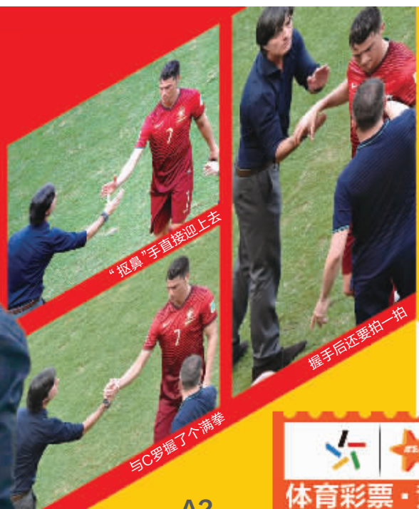
“抠鼻”手直接迎上去