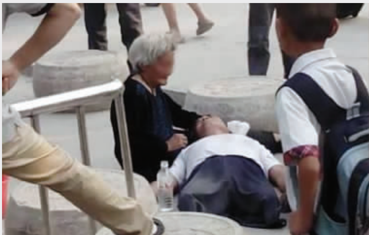
残疾老人承认,微博上热传的这张图片,拍摄于冲突发生后的第二天 微博截图