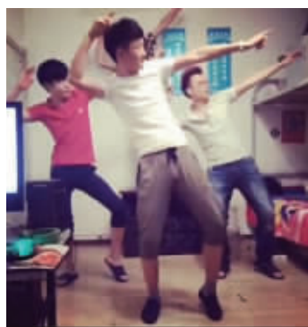
“社会摇”火了 视频截图

还在跳骑马舞、哈林摇、广场舞吗?你已经OUT了。新一轮“神舞”——“社会摇”,以其“洗脑”的摇摆动作及充满节奏感的音乐,已经在微博话题榜上获得了1.4亿的阅读量和13.5万的讨论量。而这种看似搞笑的摇摆,在专家看来,倒不失为现代人放松身心的一种好办法,不过摇摆的幅度还是得根据自己的身体状况,量力而行。