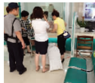
工作人员准备点钞