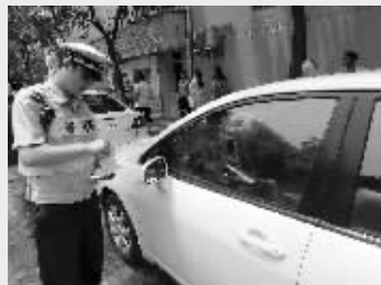
交警正在贴罚单

昨天下午，现代快报记者联系上了这位车主张先生，他已经看到了告知单，心情有点郁闷，“看见被贴了黄单子还有点郁闷，后来看了报纸才知道，原来提高处罚标准了。”张先生说，他家就在附近的小区，前一天晚上，他回家晚了，路面的泊位已经被占满，他就随便找了一个地方停了下来。