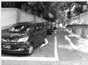
上海路五台台北站巷口，3辆车违停