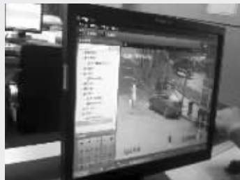
监控探头拍下的违停画面