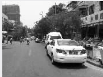
两辆车违停在汉口西路路边