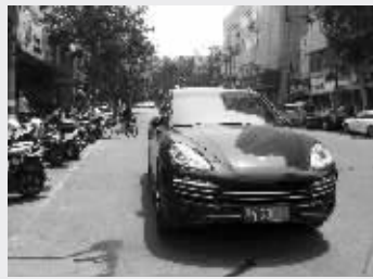
一辆车违停在宁海路菜场路边