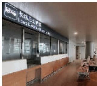
新航站楼内的长途大巴站