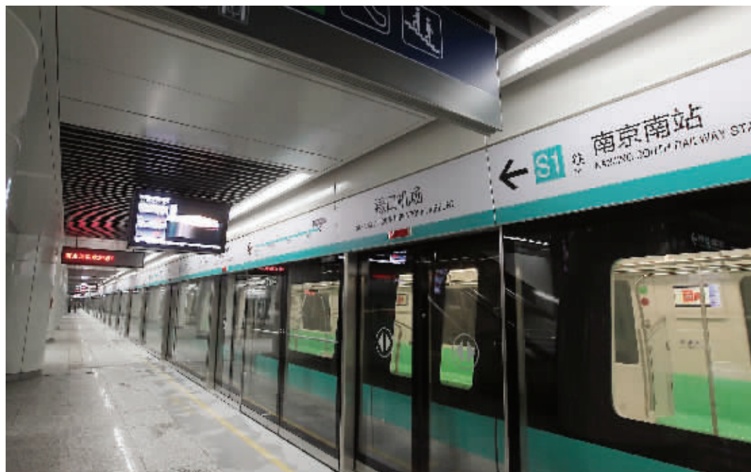
下个月起,市民就可以乘坐地铁机场线到禄口机场站了

机场相关负责人透露,机场的长途大巴主要通往周边各城市候机楼,比如扬州、淮安、马鞍山等,“主要是方便大家到禄口机场乘机的往返。”