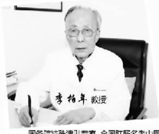
国务院特殊津贴专家 全国肛肠名老中医