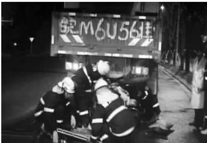
消防人员将骑摩托车的男子救出来

据现场处置事故的交警介绍,货车司机违停,车后没放置紧急停车警示牌,这是导致该事故