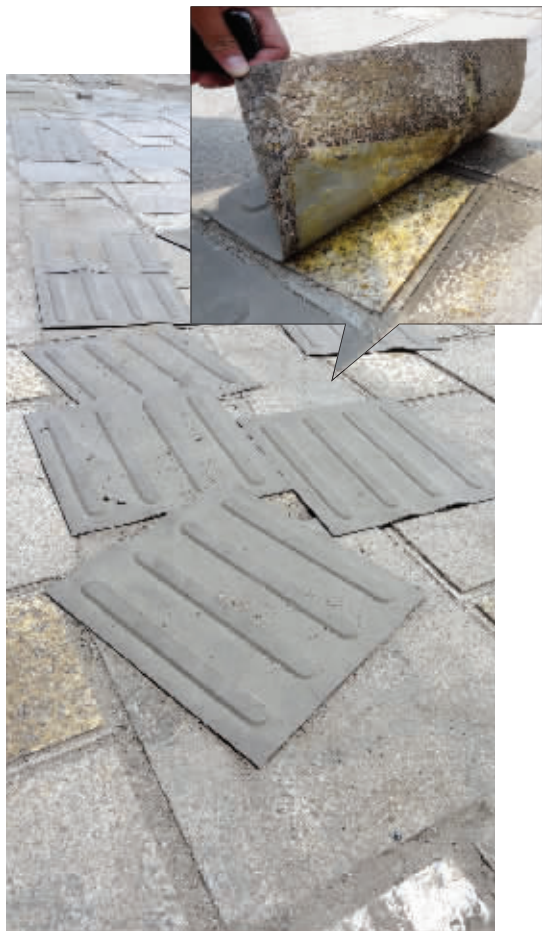
胶垫七零八落,已经不成一条盲道了 胶垫轻易就能撕开(右上图)

人行道上铺设盲道,这既是法规的要求,也体现了一个城市基本的人文关怀。近日,有市民反映,在南京市大明西路靠近永乐路路口,有一段人行道上的盲道,竟然是用胶垫贴上去的,不知是否因为胶水质量问题,很多胶垫起翘脱落,不仅难以为盲人指路,还可能成为“绊脚石”。