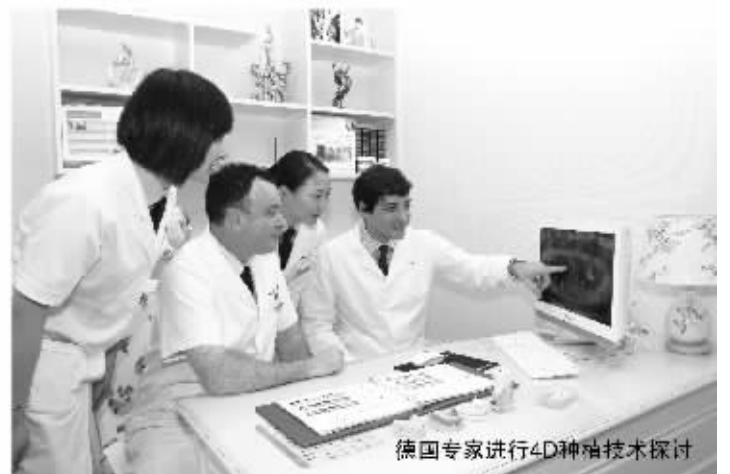
德国专家进行4D种植技术探讨

京周边城市的缺牙患者纷纷涌向南京。笔者从雅度牙科负责人处了解到,就在这两天,从苏州、无锡、常州、合肥等地过来的牙科患者大幅增加,甚至还有上海知名区的口腔机构多如牛毛,向来自有其它地方的患者来上海求医,从未听说有患者从上海到南京来看牙。