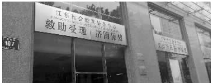
南京江东社会救助服务中心