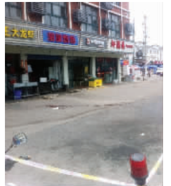
凶案现场围起了隔离带