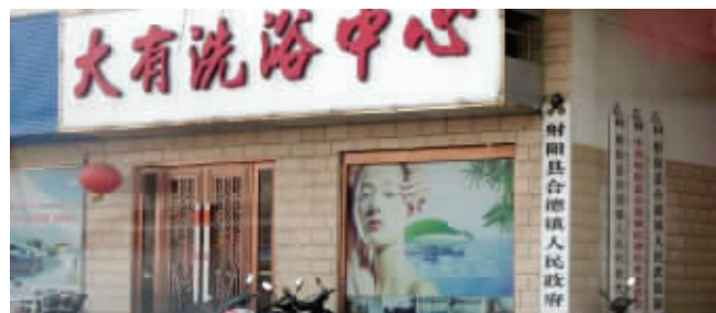
政府门牌和洗浴中心靠一起

6月8日,网友“新巴山夜雨”在盐城一地方论坛发帖质疑,射阳合德镇政府在三星级酒店办公数载,到底花谁的钱?在网帖后面还附了几张图片。