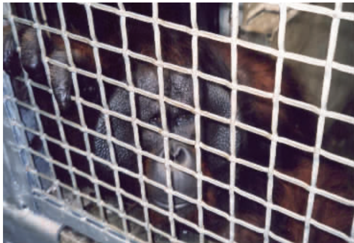
红猩猩小黑