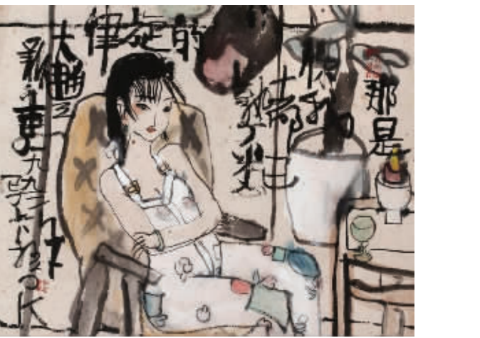
朱建忠《那是你我都已熟悉的旋律》