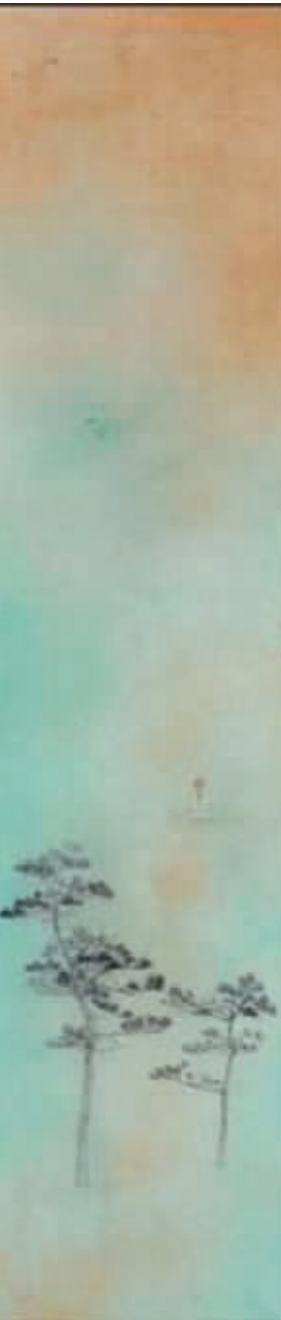
朱建忠《虚空四邻系列之一》