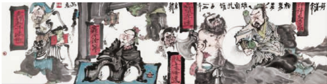
周京新《大河向东流》