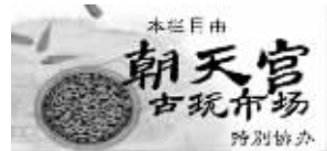
本稿件由朝天宫古玩市场提供

远古时代,人们没有照明器具也缺少火种,他们在恶劣黑暗的环境中艰难度日。最早的灯具是一种用天然具有窍孔的石头或贝壳制成的。在窍孔内放上一滴油脂,以苔藓作捻点燃就是一盏灯了。灯逐渐成为人们生活中不可或缺的东西,古代灯具记录了老祖宗智慧的变迁。