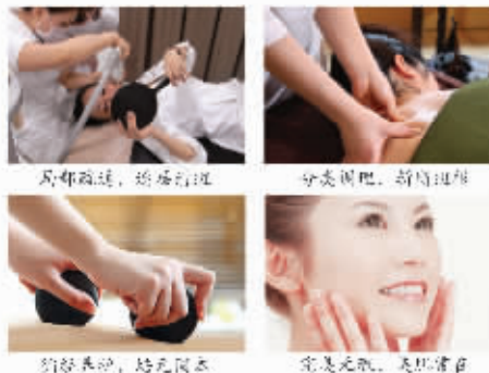
局部疏通，经络打通 分支调顺，气血通顺 经络疏通，始无斑源 完美无瑕，美肤有道

“斑”实质上是五脏六腑不健、气血津液失调在面部的反映，“经络祛斑”从一开始，就会根据皮肤与脏腑、经络、气血、津液的关系，做全面的观察与分析，并通过刺激经络来调节气血津液以求平衡，最终从根本上达到除斑养颜的目的。