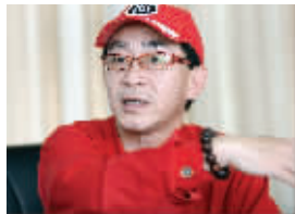
六小龄童在演讲

“同学们，大师兄看你们来了！”昨天下午，“美猴王”六小龄童为南京滨江中学的师生们做了一场“与孙悟空一起感悟西游文化”为主题的演讲。在接受快报记者采访时六小龄童透露，一直以来他有两个愿望，一个是能拍成《西游记》的电影，另一个则是建成《西游记》的主题公园。如今，这两个愿望都要实现了。