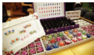
技师展示美甲所需的材料

快报讯(记者 朱蓓)还有不到10天的时间,世界杯即将开赛,而在南京,另一场“美甲世界杯”也将在7月15日正式开赛。“美甲世界杯”是由中国玉指美甲艺术学会发起的一场美甲职业技能竞技比赛,江苏站的比赛将由江苏省美容美发协会等机构承办。近年来,关于指甲油“伤人”的说法层出不穷,为了呼吁美甲行业更加规范、健康,这次比赛中将全部使用“环保材料”。据介绍,“美甲世界杯”