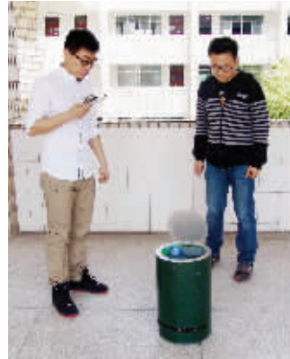
“听话”的垃圾桶

前还只是初步阶段,在功能上还有很多可以改善的地方。“比如说,这款纯手工制作的垃圾桶自重较重,耗电量较大,可以考虑更换材料,减轻重量。”周雷还设想,在垃圾桶的底盘加上一个吸尘装置,它又具备了清扫垃圾的功能。如果安装一个机械压缩装置,还可以压缩垃圾的体积,节约空间。