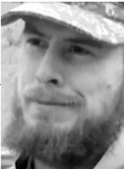
2010年被俘时期的伯格达尔