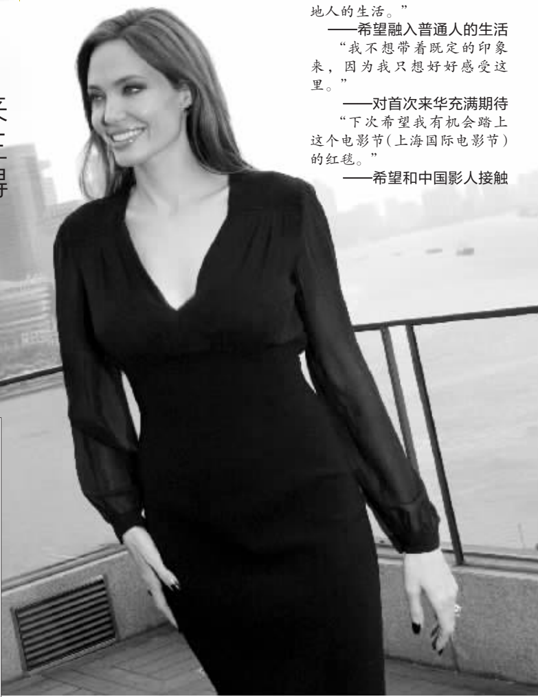
朱莉以东方明珠为背景拍照留念

安吉丽娜·朱莉走到哪里，都会吸引万千目光。昨天，这位好莱坞著名女星亮相上海外滩，为自己即将在中国上映的新片《沉睡魔咒》宣传造势。也许是为了配合电影中“黑女巫”的形象，她身穿一袭黑裙，还涂上了黑色的指甲油，充满魅惑之美。在黑色的“底色”之上，朱莉搭配了金色的高跟鞋，银色的戒指，显得熠熠生辉。据悉，这是朱莉第一次来中国，此行她还带来了老公布拉德·皮特和三个孩子。