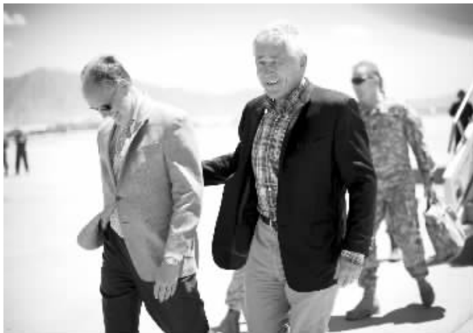
美国防长哈格尔6月1日飞抵阿富汗