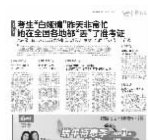
2013年6月7日快报相关报道