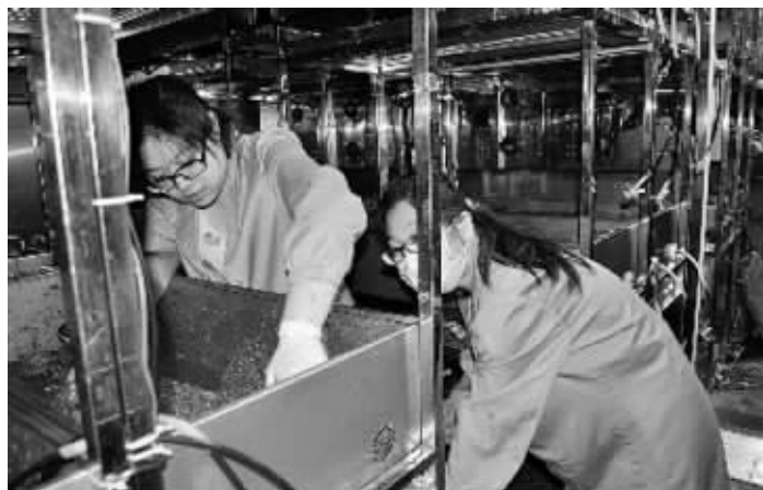
工作人员清理培养槽内的人工基质

刘红说,舱内不能吃的作物,研究人员会进行相关处理。比如,植物的秸秆和根部将做成类土壤基质,用来为以后的实验栽培植物。