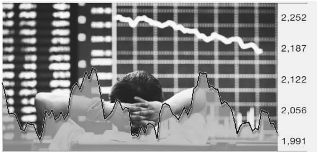
上证指数今年以来走势 本版制图 李荣荣