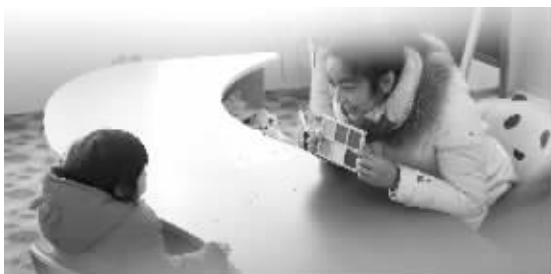
今年2月, 一位早教老师在给孩子上课(资料图片)