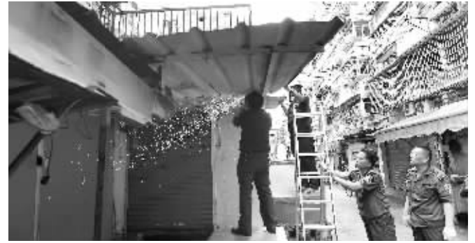
城管拆除乱搭建的棚子

快报讯(记者 李宇龙)秦淮区洪武路街道的文思新村小区旁边,是南京环服装批发市场。由于市场里的经营商户比较多,为了解决他们的吃饭需求,附近的餐饮业也随之发展起来。“他们在小区20幢楼和21幢楼之间的空地上搭起棚子,在里面卖饭。还有有的商户直接买下或者租下21幢一楼的房子,开起了餐馆。”文思新村小区居民说,这种情况已经存在10年左右的时间了,严重影响他们的正常生活。