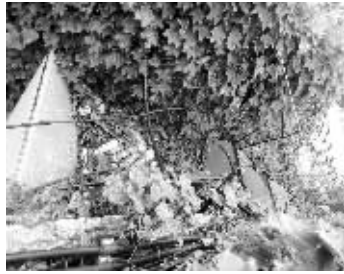
天堡城观景台外侧的垃圾