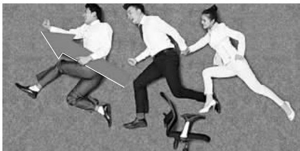
职场充电切忌盲目跟风

专家建议,如果工作时间较长,没有整段的时间参加培训课程,可以选择一些网络学习课程,花的钱不多,时间也比较灵活,只需把休息的时间拿出一点,积少成多。此外,还可以加入一些专业“圈子”,遇到专业问题时,拿出来讨论,这种“充电”更有针对性,也更能解决问题,效果往往更明显。